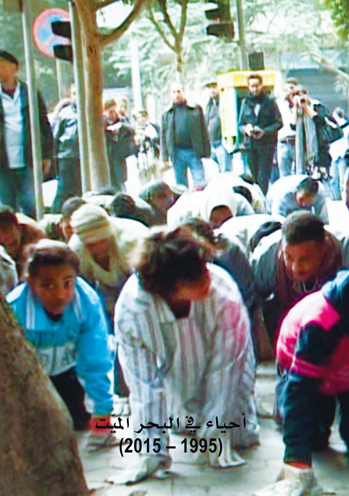
أحياء في البحر الميت (1995 - 2015)